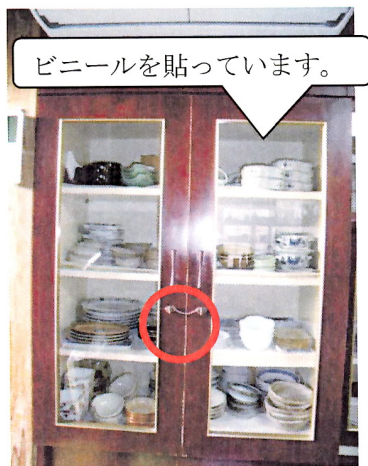
食器棚のガラス飛散防止